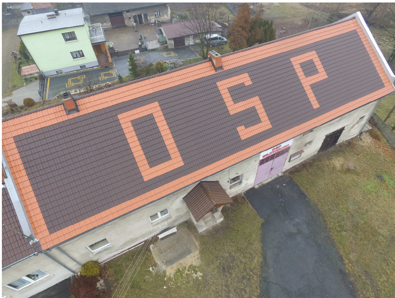
Fotografia nr 1. Elewacja budynku.

Obiekt wybudowany w technologii tradycyjnej murowanej. Budynek 1-kondygnacyjny z poddaszem. Dach budynku drewniany płatwiowo - krokwiowy o rozpiętości ~41,80 m x ~10,96 m. Pokrycie dachu – dachówka. Dach po generalnym remoncie w 2012r.