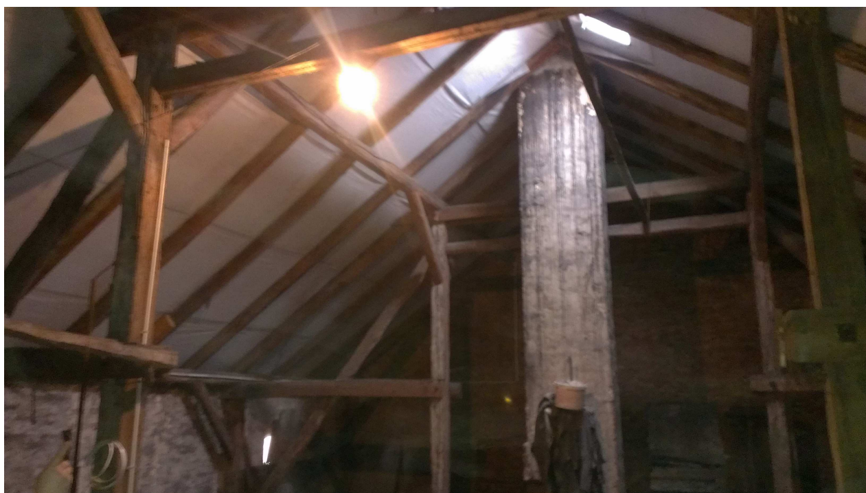
Fotografia nr 3. Widok więźby dachowej.